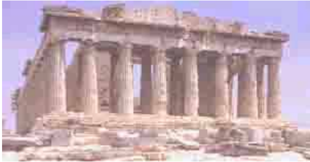
El Partenón: Templo a la gloria del pensamiento